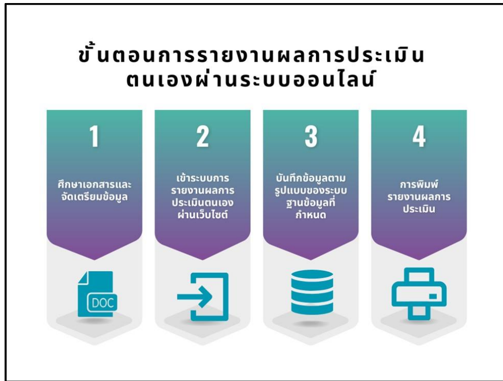
ภาพที่ 7.1 การรายงานผลการประเมินตนเองผ่านระบบออนไลน์

การรายงานผลการประเมินตนเองผ่านระบบออนไลน์ แสดงดังภาพที่ 7.1